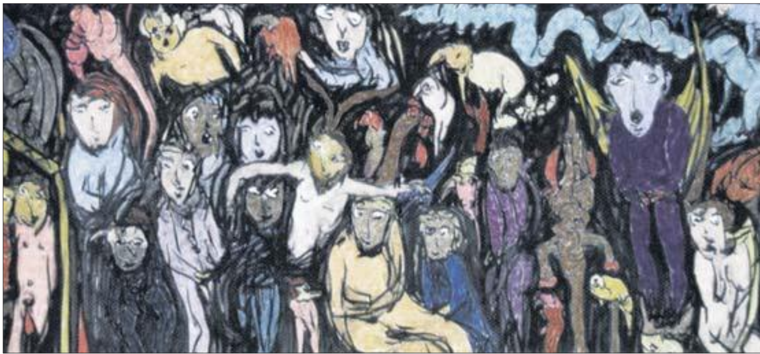
MANGFOLD: da Silvas bilder er preget av mangfold.