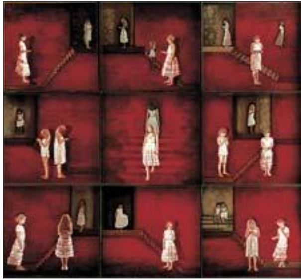
ROM: Lise Simonnæs stiller ut i Hole Artcenter.